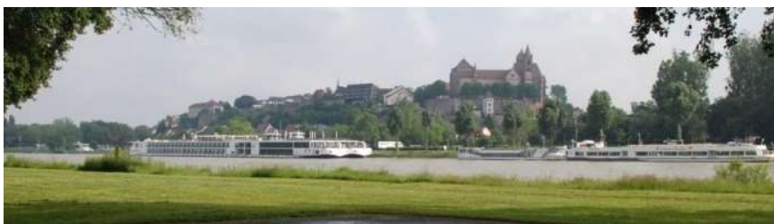
Depuis l'Île du Rhin, vue sur les bateaux de croisière amarrés à la rive droite du Rhin à Breisach-am-Rhein

Les possibilités de plaisance liées à ce réseau fluvial sont relativement limitées, dans la mesure où la plaisance sans permis de navigation (correspondant aux produits de location touristique) est limitée au seul canal de Colmar jusqu'à l'écluse du Rhin : les plaisanciers sans permis ne peuvent pas passer du canal de Colmar au canal Saône-Rhin ni au Canal de la Marne au Rhin car il leur faut pour cela un titre de navigation leur permettant de naviguer sur le Rhin. Cela limite la plaisance occasionnelle (sans permis) à un linéaire très limité, qui peut largement se pratiquer dans la journée, contrairement à d'autres régions fluviales et contrairement au canal de la Marne au Rhin au nord de Strasbourg et au canal Saône-Rhin au Sud de Mulhouse qui offrent de plus larges possibilités d'itinérance au fil de l'eau sur plusieurs jours.