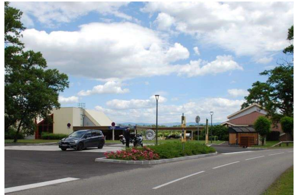
Musée gallo-romain et musée de l'optique de Maison des Energies à Fessenheim Biesheim

Les autres équipements muséographiques et culturels de Rhin-Brisach sont :