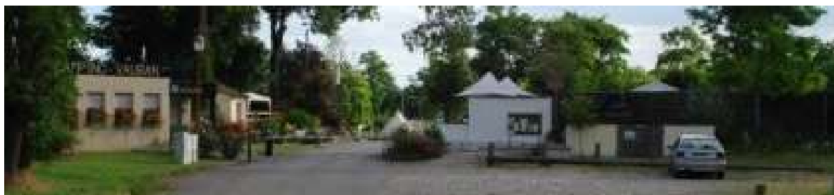
Entrée du camping Vauban de Neuf-Brisach

C'est plutôt sur le camping qu'il faut compter pour accueillir les séjours touristiques dans la bande rhénane. Rhin-Brisach apparaît nettement plus équipé que les territoires voisins. L'emplacement du camping Vauban à Neuf-Brisach est de surcroît idéalement localisé à un emplacement stratégique, aux portes de la place forte et de ses remparts, en plein cœur de l'agglomération pluricommunale de Neuf-Brisach-Biesheim-Volgelsheim et à proximité de ses équipements et services, au croisement de l'axe formé par la D415 entre Colmar et Freiburg et de l'antique voie romaine orientée nord sud le long du Rhin et enfin en plein sur le parcours de la véloroute du Rhin. Le camping de l'île du Rhin, situé non loin de là, tout aussi bien placé, est le plus important en capacité.