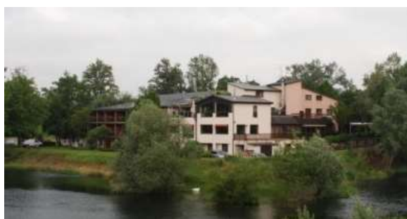
Hôtel le Caballin à Vogelgrün

L'équipement hôtelier de Rhin-Brisach en 2017 – Enquête INSEE