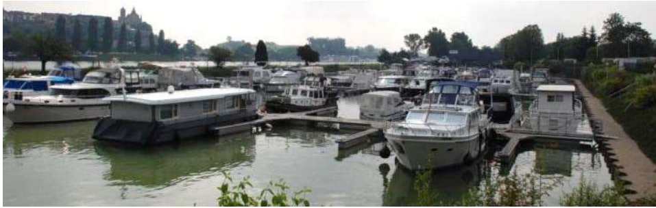
Le port de plaisance de l'Île du Rhin (Biesheim)

Une halte fluviale a été aménagée et équipée à Kunheim, sur le linéaire de l'ancien canal Saône-Rhin. D'une capacité de 16 emplacements, elle est équipée de bornes électriques, de branchements eau et d'un local sanitaire.