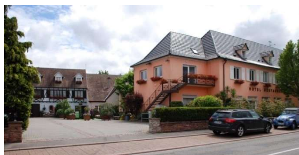
Hôtel-restaurant Aux Deux Clés à Biesheim