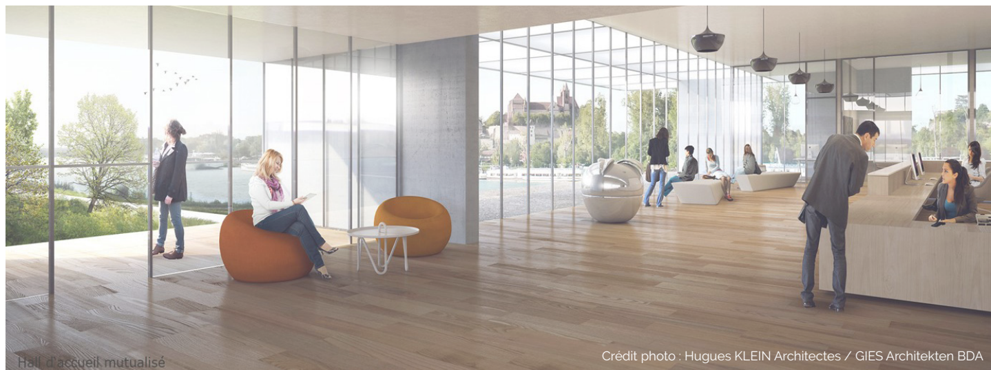
Hall d'accueil mutualisé

Art'Rhena sera aussi la résidence du centre culturel rhénan de création.