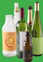
BOUTEILLES EN VERRE (sans couvercle ni bouchon)