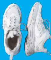
CHAUSSURES (attachées par paire)