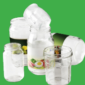
BOCAUX, POTS ET FLACONS DE PARFUM EN VERRE (sans couvercle ni bouchon)