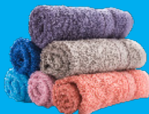
LINGE DE MAISON