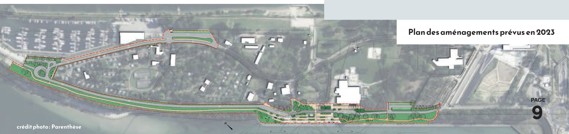
Plan des aménagements prévus en 2023

DURANT LA PÉRIODE DES TRAVAUX, L'ENSEMBLE DES ÉQUIPEMENTS PRÉSENTS SUR L'ÎLE DU RHIN (ART'RHENA, LE CAMPING, LA PISCINE SIRENIA, LES DIVERS LIEUX DE RESTAURATION, LE PORT DE PLAISANCE, ETC.) RESTERONT NATURELLEMENT OUVERTS ET ACCESSIBLES.