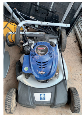
Bricolage et jardinage thermique