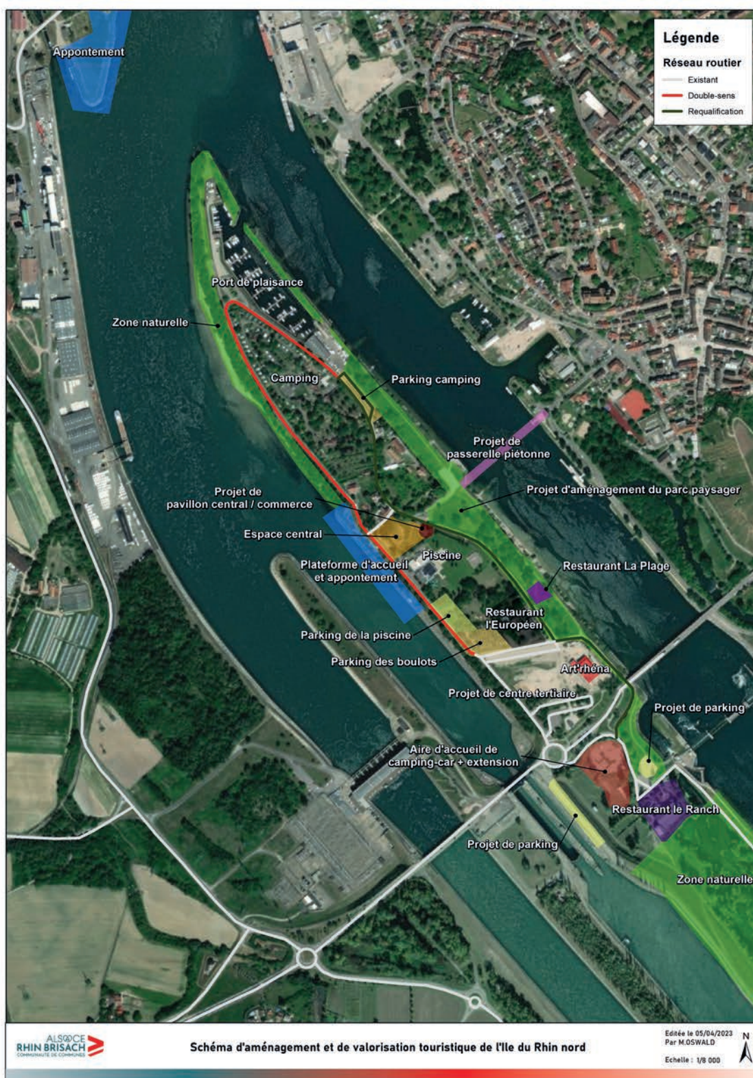
Schéma d'aménagement et de valorisation touristique de l'Île du Rhin Nord - CCARB

Sous l'impulsion du centre culturel transfrontalier Art'héna , l'Île du Rhin tend à poursuivre son développement en tant que site touristique majeur du territoire, complémentaire à la cité remarquable de Neuf-Brisach.