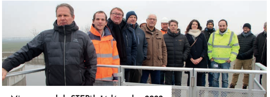
Mise en eau de la STEP le 14 décembre 2022

Dans le cadre de la mise en conformité du système d'assainissement des communes de Durrenentzen, Urschenheim, Muntzenheim et Widensolen, la CCARB a engagé la construction d'une nouvelle station d'épuration (STEP) intercommunale à Urschenheim.