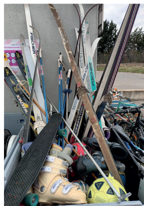
Sports et loisirs