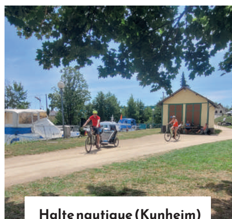
Halte nautique (Kunheim)