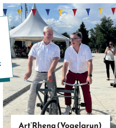
Art Rhena (Vogelgrun)

Le dynamisme du territoire a été marqué par ses 3 places festives :