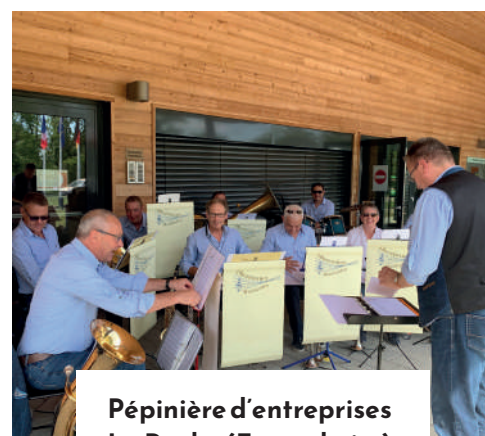
Pépinière d'entreprises La Ruche (Fessenheim)