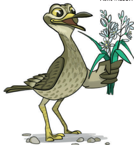
Illustration: Pierre WISSON

Depuis 2021, la Communauté de Communes assure l'animation du secteur Natura 2000 « zones agricoles de la Hardt » pour la mise en œuvre d'actions concrètes, entre autres, en faveur de l'Œdicnème criard . L'espèce étant encore très méconnue, des études approfondies sont menées par l'association LPO Alsace pour mieux comprendre ses besoins.